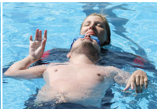
PLAVÁNÍ LÉČÍ. Na snímcích je zachycena výuka nejmenších dětí a individuální výuka dospělých.

cita plic a zlepšuje fyzická kondice. „Plavání zkrátka považujeme za ideální pohyb pro osoby s tělesným handicapem, ať už se mu budou chtít věnovat z rehabilitačních důvodů nebo budou