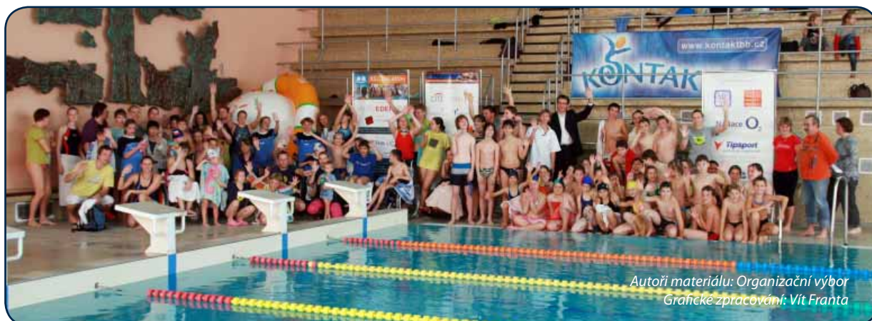
Autoři materiálů: Organizační výbor Grafické zpracování: Vít Franta

Více se o sdružení dozvíte na www.kontaktbb.cz nebo na Facebooku.